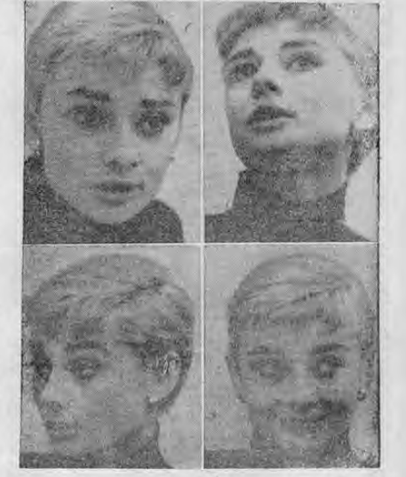
Cuatro aspectos de la actriz... Audrey Hepburn