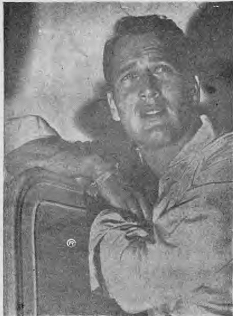
Paul Newman se ha hecho famoso interpretando los dramas de Tennessee Williams. Ahora aparece nuevamente en la pantalla en la cinta "Pájaro de la Dulce Juventud" obra de ese gran escritor de esta generación.

Uno de los más notables dramas de Tennessee Williams, "El Dulce Pájaro de la Juventud", que con gran éxito se estuvo representando en los teatros de Broadway por más de dos años,