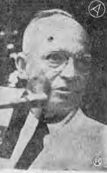
EISENHOWER Reunión social y política con Adenauer.

Pero Adenauer y Eisenhower no se limitaron a conversaciones puramente sociales, con versando durante una hora después de la recepción y antes de la comida en la cancelaría, sobre asuntos de política internacional.