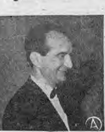
Don PEPE FIGUERES