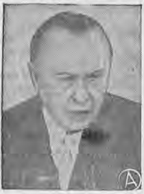
ADENAUER Conversó con IKE.

● BONN, ALEMANIA, 2 —El presidente Dwight Eisenhower y el canciller alemán, Konrad Adenauer se reunieron esta noche en un acto puramente social, al que asistieron la esposa del ex mandatario porte americano, los demás acompañantes de éste y varios diplomáticos y altos funcionarios del gobierno.