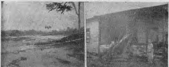
Las inundaciones en San Carlos han alcanzado el punto culminante en esta semana. Las gráficas dan una idea somera de la tragedia.