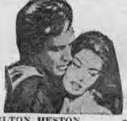
CHARLTON HESTON Super Tecnitrama SOFIA LOREN Tecnicolor Sólo en VARIEDADES

3 y 7 ..... $ 5.00 Ninguna película produce un delirio semejante! El espectáculo más fabuloso que ha desfilado por nuestras pantallas! La apasionante historia de EL CID CAMPEADOR en toda su deslumbrante magnificencia!